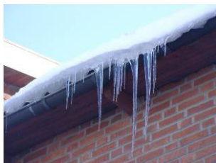
Bild 2. Istappsbildning pga av värmen från vindsutrymmet

Orsaken till att vi förr ventilerade vindsutrymmet var för att kyla av yttertaket så att snön inte smälte på yttertaket och frös till is vid takfoten (ref 2). Detta behövs inte längre då dagens tjockare isolering innebär att yttertaket blir kallt även utan ventilering.