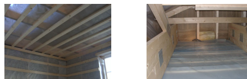
Bild 4 Den folie som läggs i bjälklag av trä skall vara lufttät och tillräckligt diffusionstät (ångtät). Folien benämns olika saker beroende på vilken funktion som avses och i viss mån dess egenskaper. Benämningen konvektionsspärr avser att folien skall vara lufttät medan benämningen ångspärr eller ångbroms avser att begränsa diffusionen av ånga till konstruktionen. Ångspärren är tätare än ångbromsen men båda uppfyller funktionen att vara tillräckligt ångtät i ett vindsbjälklag. Andra viktiga egenskaper är att den skall vara beständig, lättarbetad och rivtålig.