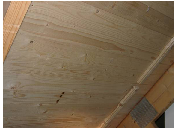
Bild 1 Ingen synlig påväxt men riklig påväxt enligt den mikrobiologiska analysen. Detta är normalt ingen skada - återkommande kontroll är alltid att rekommendera!

Ett sätt att minska risken för att påväxt skall uppkomma är att säkerställa att yttertaket är tätt, att hindra fuktig inneluft kommer upp till vindsutrymmet och att ventilerade vindsutrymmet lagom mycket.